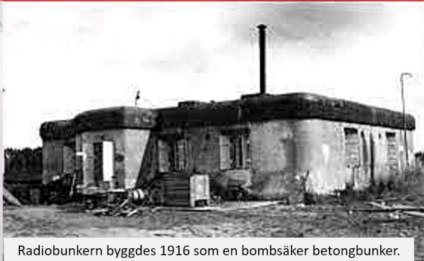
Radiobunkern byggdes 1916 som en bombsäker betongbunker.