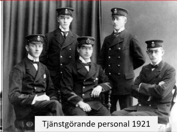
Tjänstgörande personal 1921