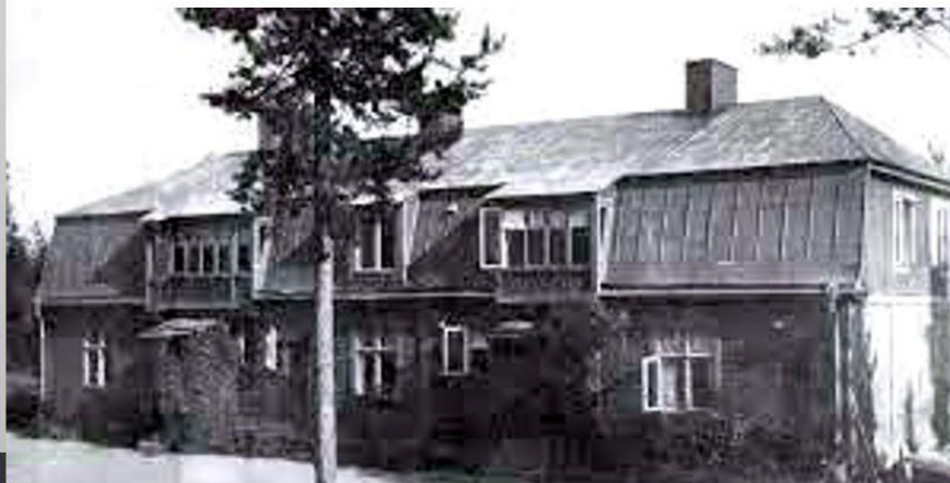
Radiovillan byggdes i närheten och inhyste den betjänande personalen.