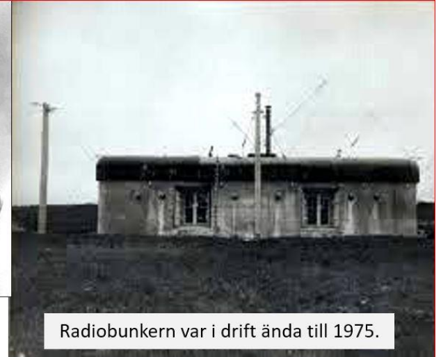
Radiobunkern var i drift ända till 1975.